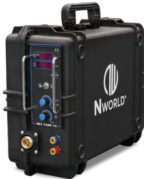
SKY YARD 15

Nuovo Kit con 5 programmi di saldatura New Kit with 5 welding programs