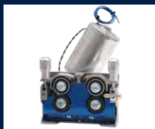
Traino 4 rulli in alluminio