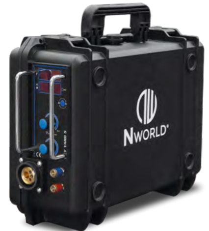
SKY YARD 5