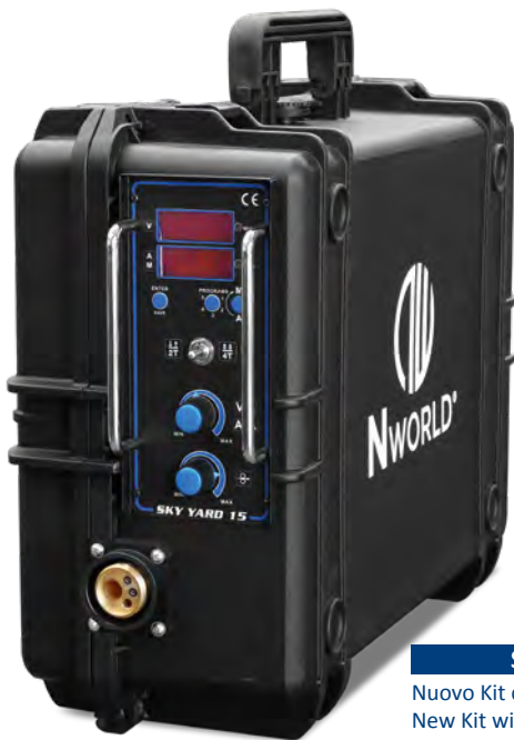
SKY YARD 5-15 P

Nuovo Kit con 5 programmi di saldatura New Kit with 5 welding programs